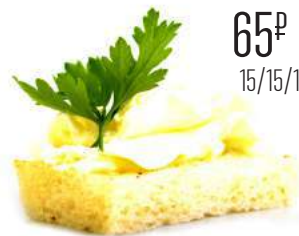
КАНАПЕ С СЫРОМ ФИЛАДЕЛЬФИЯ