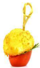
ХРУСТЯЩАЯ МОЦАРЕЛЛА НА ПОМИДОРКЕ ЧЕРИ