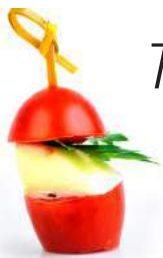
МИНИ - КАПРЕЗЕ