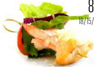
ЦЕЗАРЬ С КУРИЦЕЙ И КРЕВЕТКОЙ