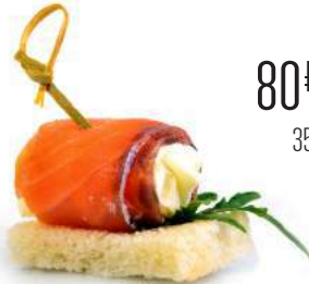
ПОДКОПЧЕННАЯ СЕМГА - СЫРНЫЙ КРЕМ