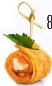
БЛИННЫЙ РУЛЕТИК С СЕМГОЙ И СЫРОМ ФИЛАДЕЛЬФИЯ