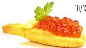
«ПЕСОЧНАЯ» ЛОЖЕЧКА С ИКРОЙ ПОСОСЕВОЙ