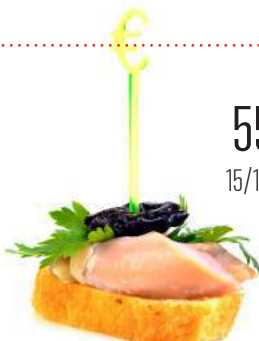
ОБЖАРЕННЫЙ ТОСТ С КОПЧЕНОЙ КУРИЦЕЙ И ЧЕРНОСЛИВОМ