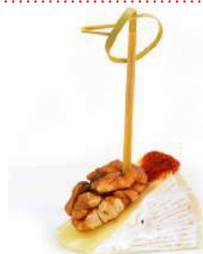
КАНАПЕ С ГРЕЦКИМ ОРЕХОМ И СЫРОМ БРИ