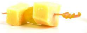
СЫРНЫЕ «КУБИКИ» С ВИНОГРАДОМ