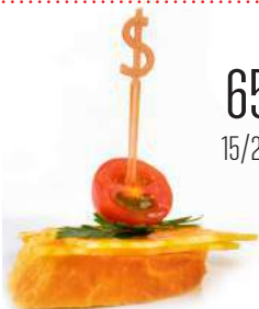
КАНАПЕ С МРАМОРНЫМ СЫРОМ И ПОМИДОРКОЙ «ЧЕРИ»