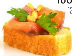
КАРПАЧЧО ИЗ ЛОСОСЯ С ИМБИРНЫМ МАРИНАДОМ