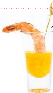
ТИГРОВАЯ КРЕВЕТКА В МАНДАРИНОВОМ СОУСЕ