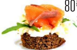
СОЛЕНАЯ СЕМГА НА ТОСТЕ ИЗ БОРОДИНСКОГО ХЛЕБА В СЫРНО – ТВОРОЖНОМ СОПРОВОЖДЕНИИ