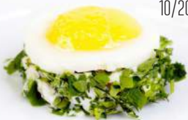
КАНАПЕ С ЖАРЕННЫМ ПЕРЕПЕЛИНЫМ ЯЙЦОМ