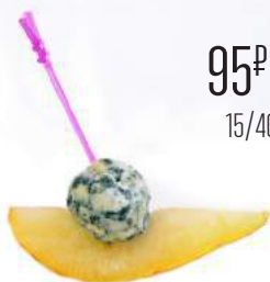
ДОР-БЛЮ НА СОЧНОЙ ГРУШЕ