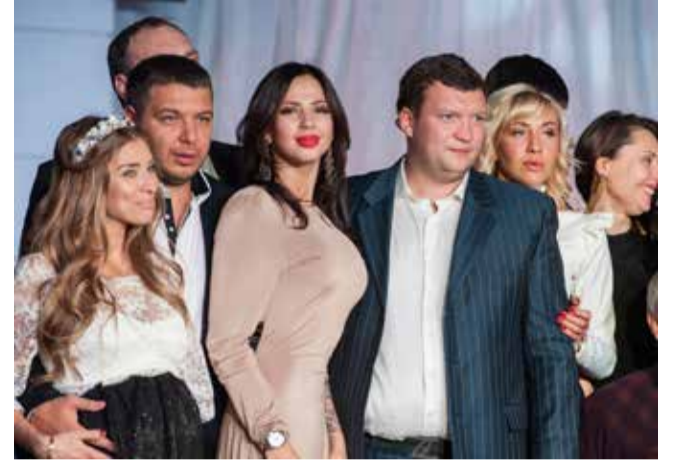
Прославленная гимнастка Дарья Дмитриева была на аукционе в 2014 году

В 2015 году на мероприятии было собрано около трех миллионов рублей. Часть из них уже освоена: воспитанницы школы смогли съездить на несколько значимых соревнований, в частности, на первенство России в Казань и Всероссийские соревнования в Барнаул. Также из бюджета Благотворительного фонда были выделены деньги для участия во Всероссийском турнире по художественной гимнастике в Томске, где иркутские гимнастки заняли третье место в групповых выступлениях, а 7 человек выполнили норматив мастера спорта. Сразу после этих соревнований команда старших воспитанниц выступила на Всероссийском турнире «Весенний кубок» в Красноярске, где заняла призовые места: почти все иркутские спортсменки вернулись с медалями. После Красноярска наши гимнастки отправились в Омск – на чемпионат Сибирского Федерального округа. Для иркутских спортсменок было очень важно побывать на них и выступить достойно, ведь по итогам турнира состоялся отбор на чемпионат России. В итоге из 16 юных гимнасток, прошедших на чемпионат страны, 5 спорт-