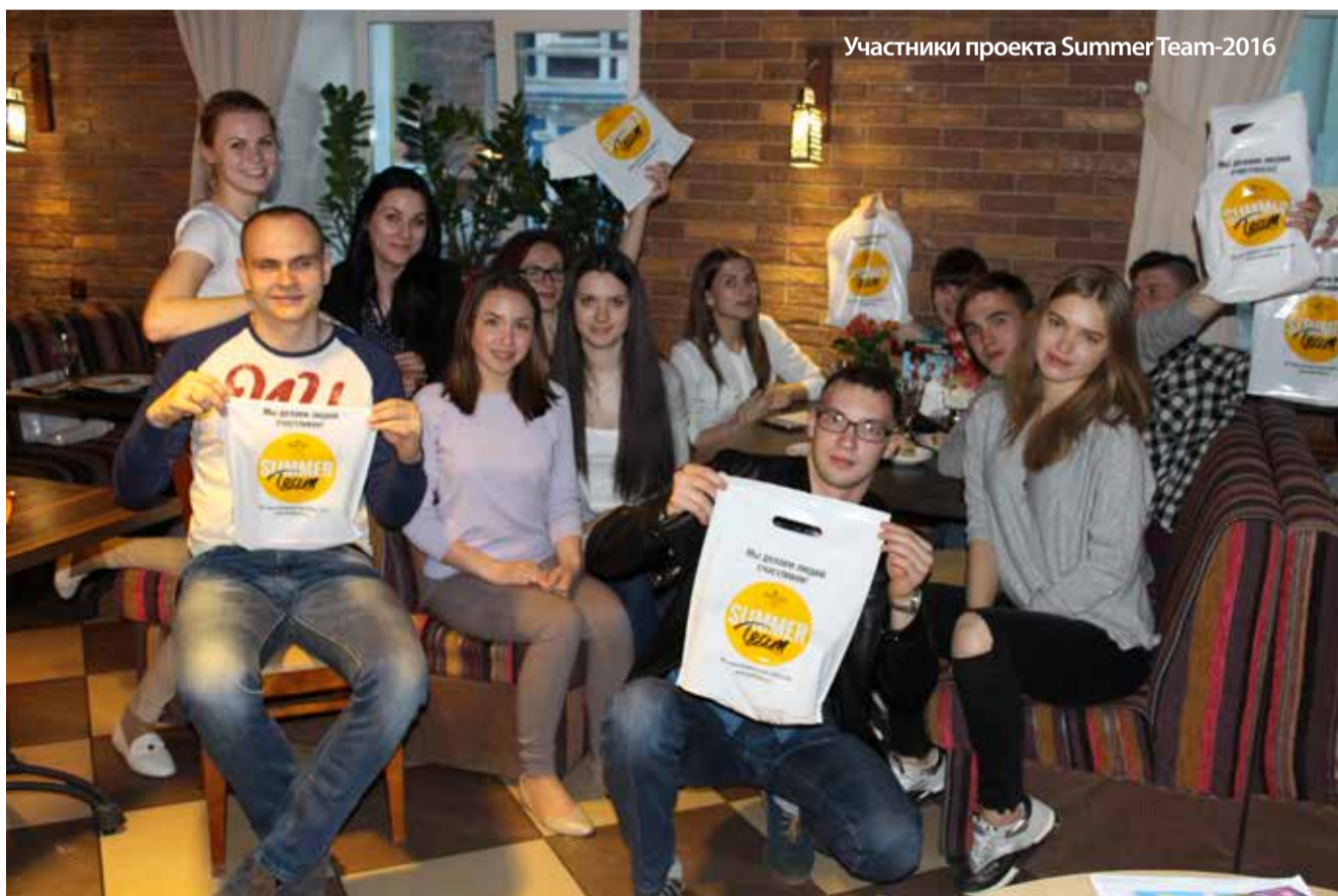
Участники проекта Summer Team-2016

На этом наша интересная беседа закончилась, Анна поспешила к своим «юным подопечным» - ребятам с проекта Summer Team-2016, которые совсем скоро вольются в ряды сотрудников нашей компании.