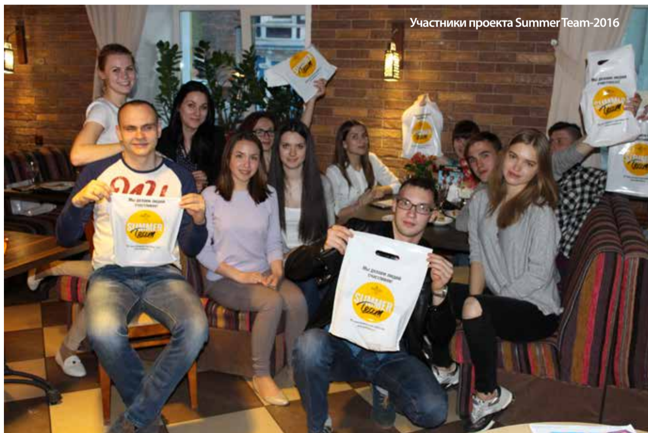
Участники проекта Summer Team-2016

На этом наша интересная беседа закончилась, Анна поспешила к своим «юным подопечным» - ребятам с проекта Summer Team-2016, которые совсем скоро вольются в ряды сотрудников нашей компании.