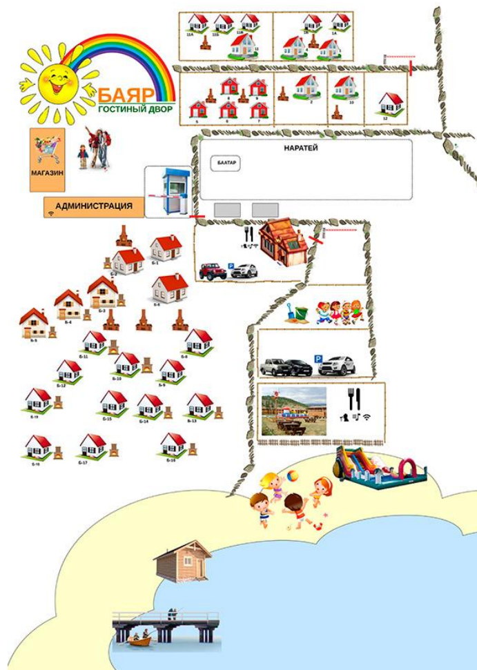
Схема базы отдыха