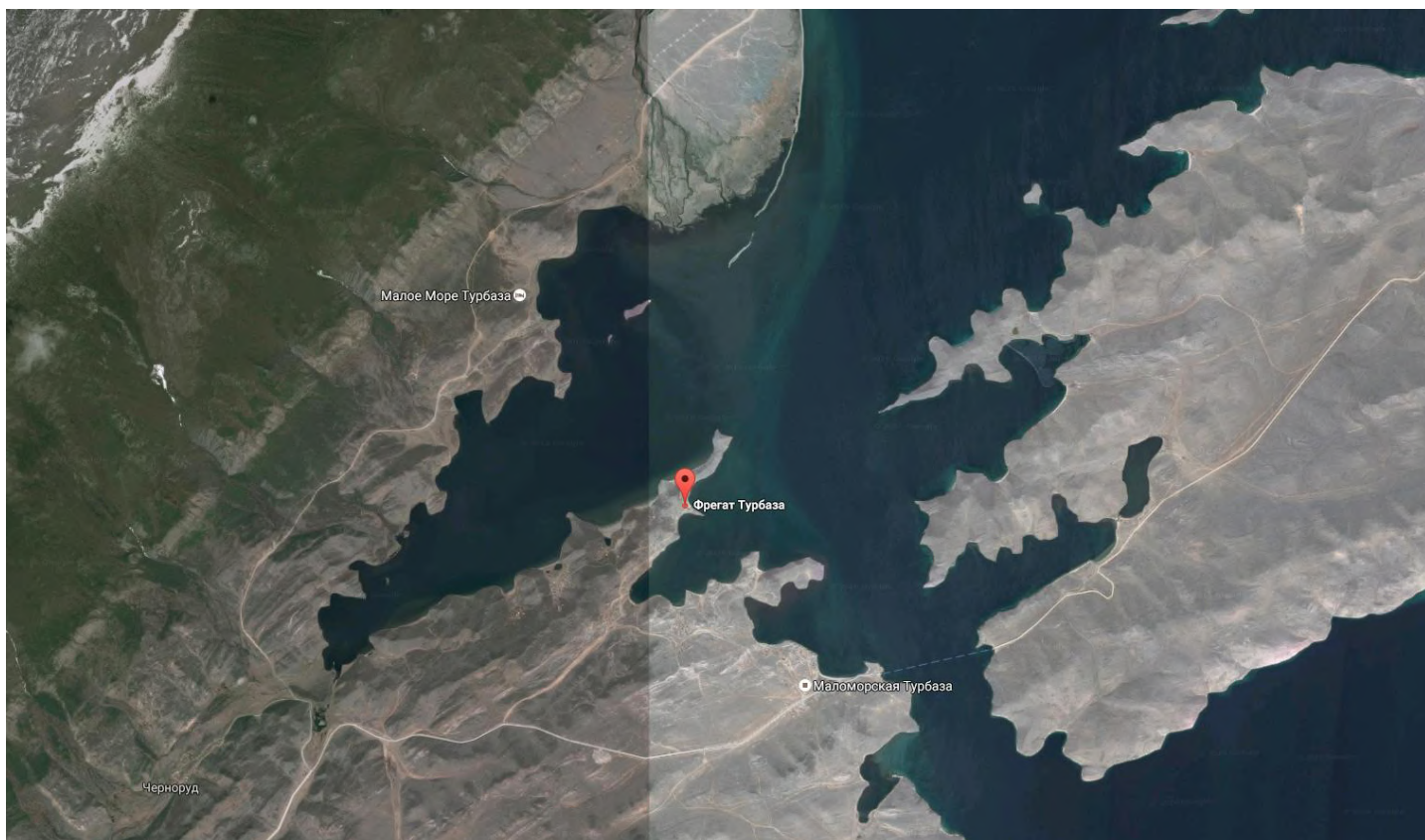
Схема базы отдыха