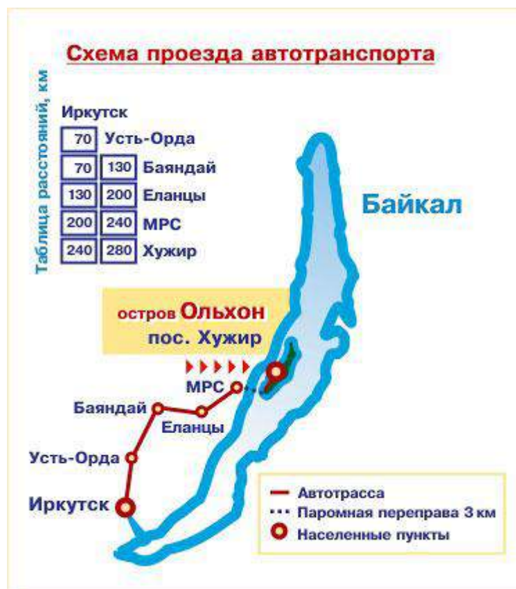
Схема расположения базы отдыха